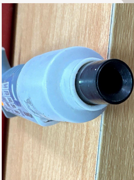
Fig. 3: Cono