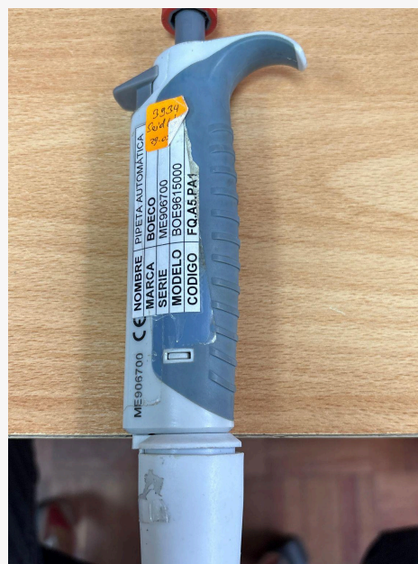
Fig. 2: Vista general del Equipo (Vista lateral derecha)