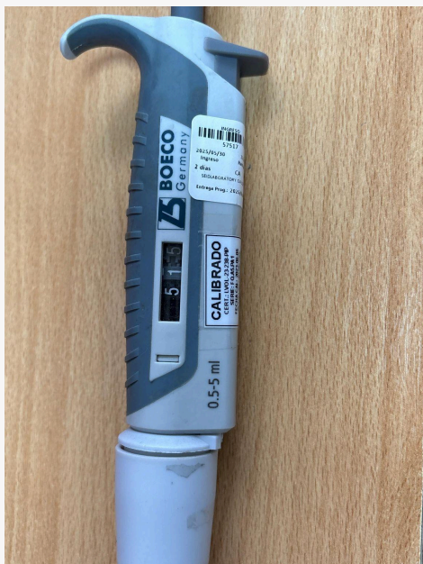
Fig. 1: Vista general del Equipo (Vista lateral izquierda)