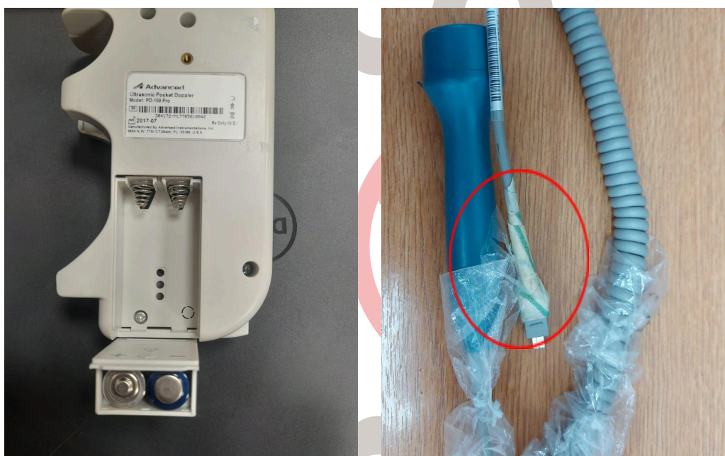
Figura 2. Parte eléctrica y daño en recubrimiento del sensor.