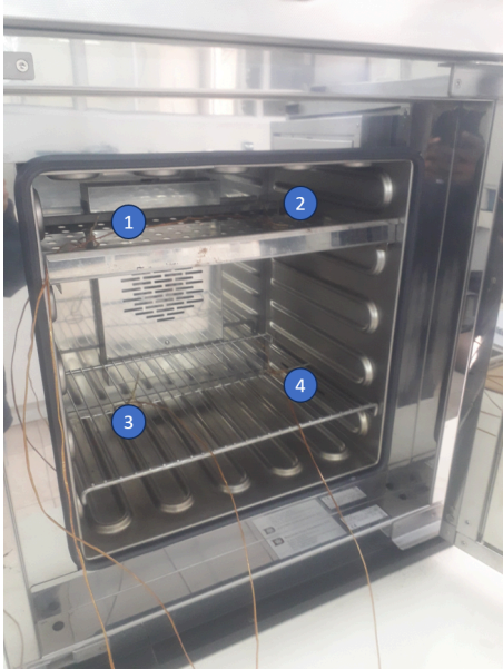
Diagram de Posición de Sensores (Sensor Position Diagram)