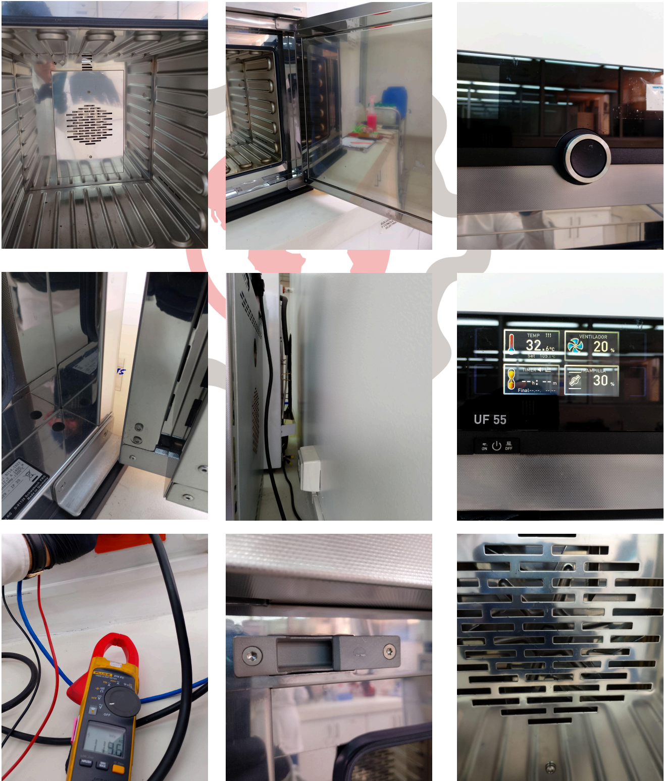
Fig. 1 Mantenimiento preventivo básico