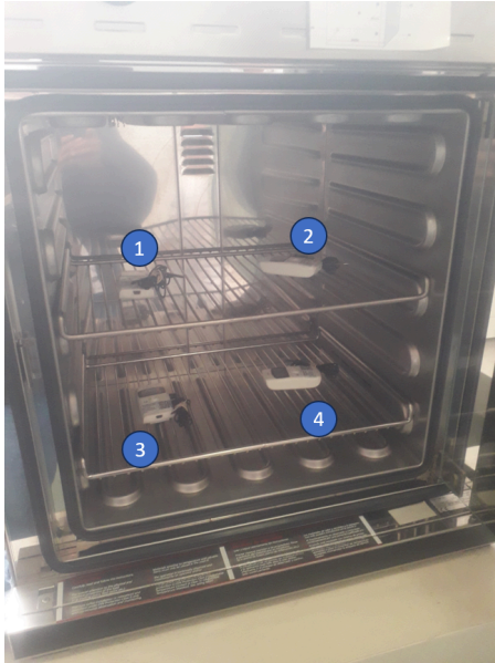
Diagram de Posición de Sensores (Sensor Position Diagram)