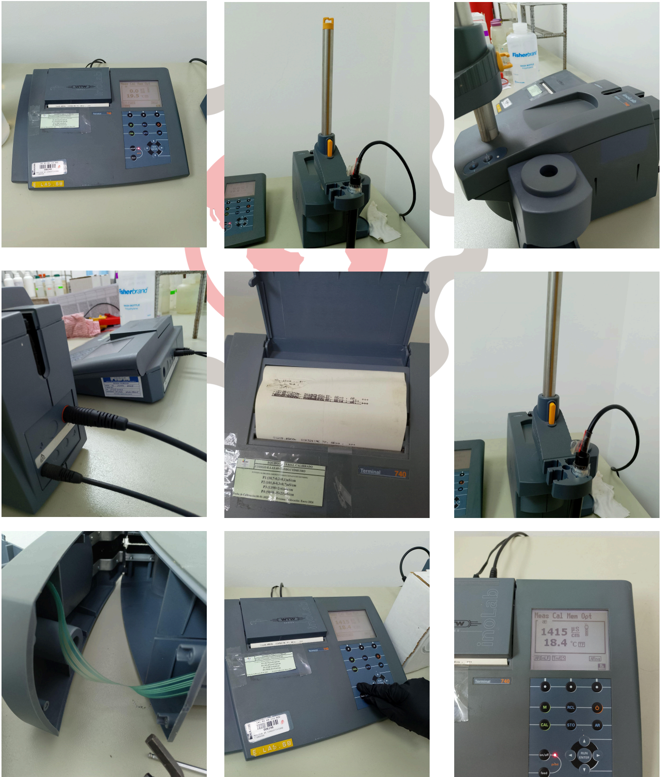
Fig. 1 Mantenimiento preventivo básico