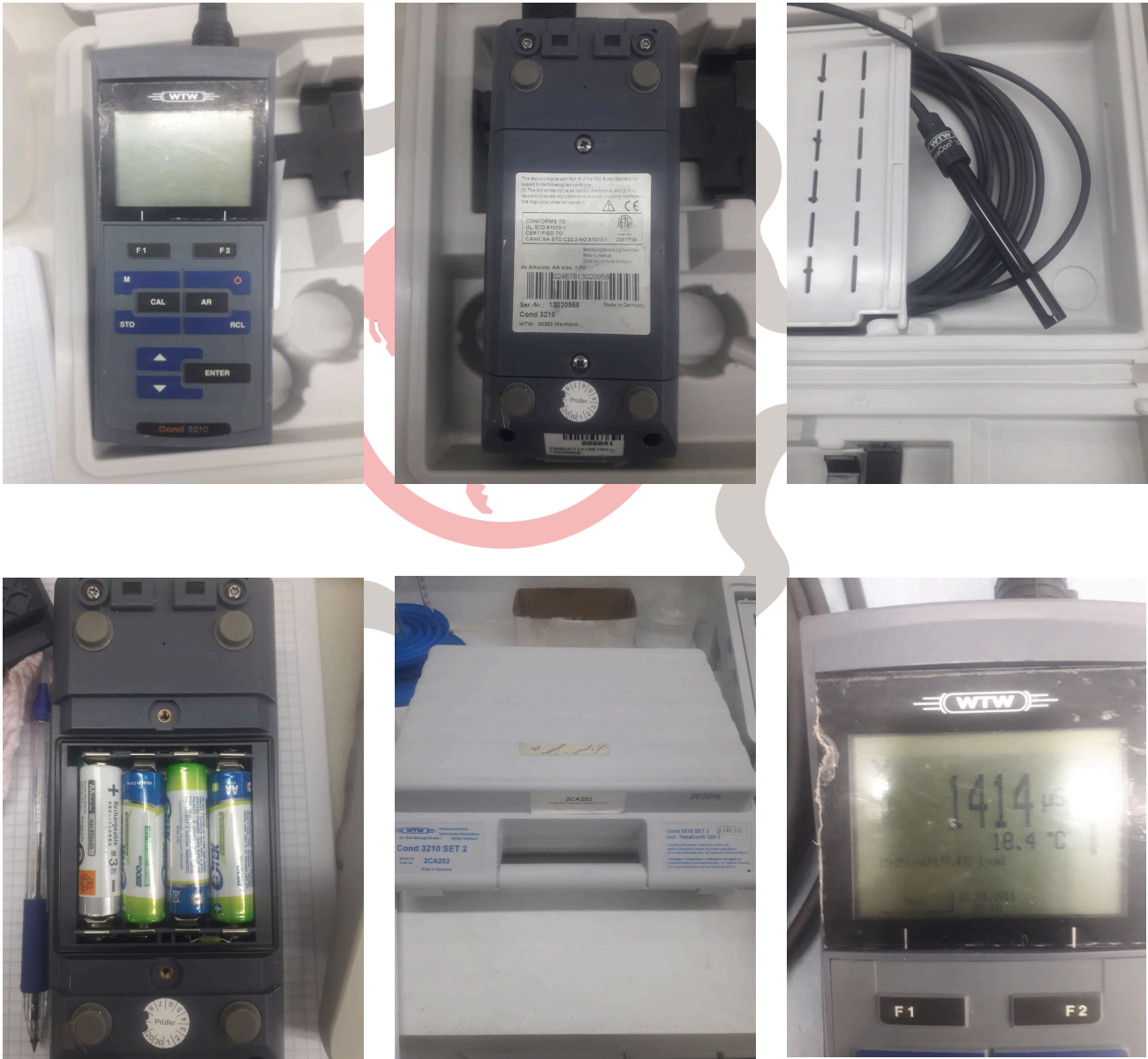
Fig. 1 Mantenimiento preventivo básico