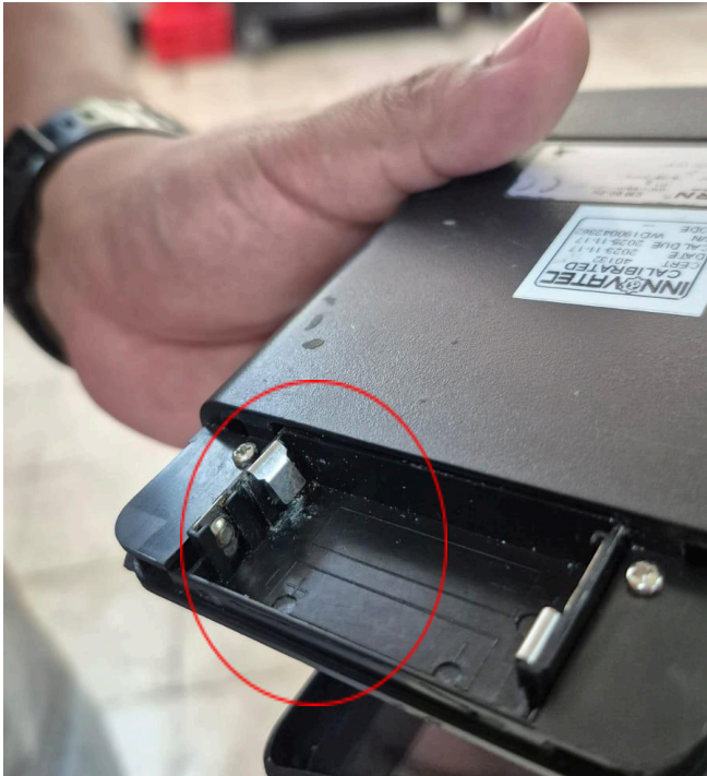
Figura 1: Puerto de baterías.