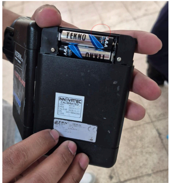
Figura 2: Baterías nuevas.