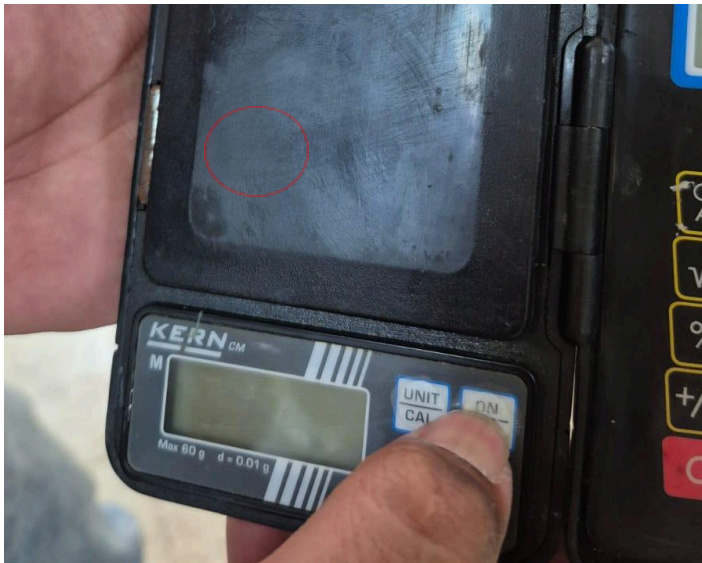
Figura 3: Equipo no enciende.