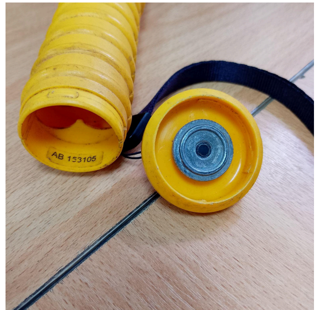
Fig. 1 Vista general del Equipo (Vista frontal y posterior)