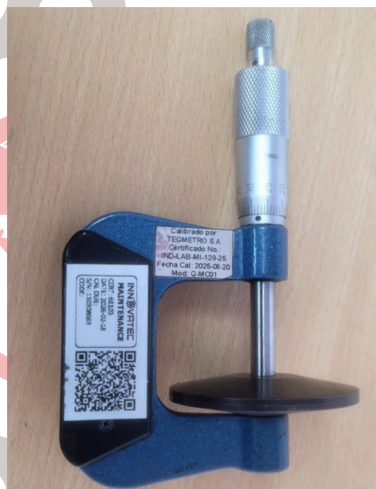
Figura 3. Limpieza del equipo.