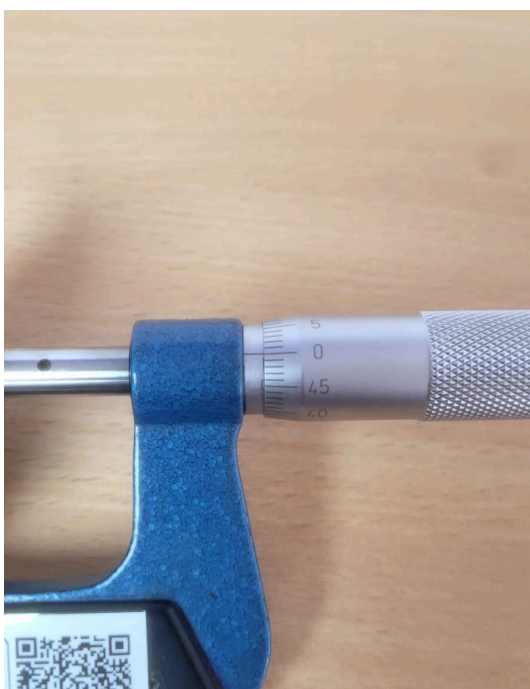
Figura 2. Punto cero corregido.