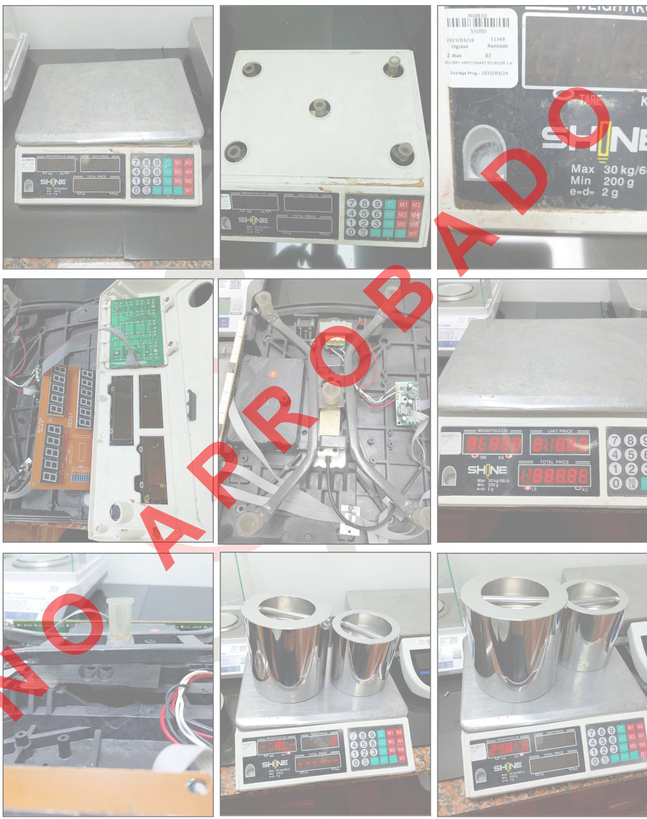
Fig 1. Mantenimiento Preventivo Básico