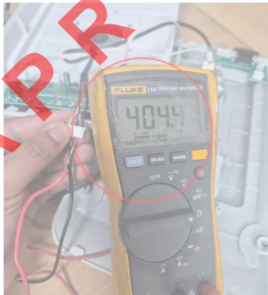
Figura 2. Valor de resistencia de entrada de la celda.