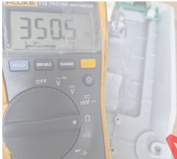
Figura 3. Valor de resistencia de salida de la celda.