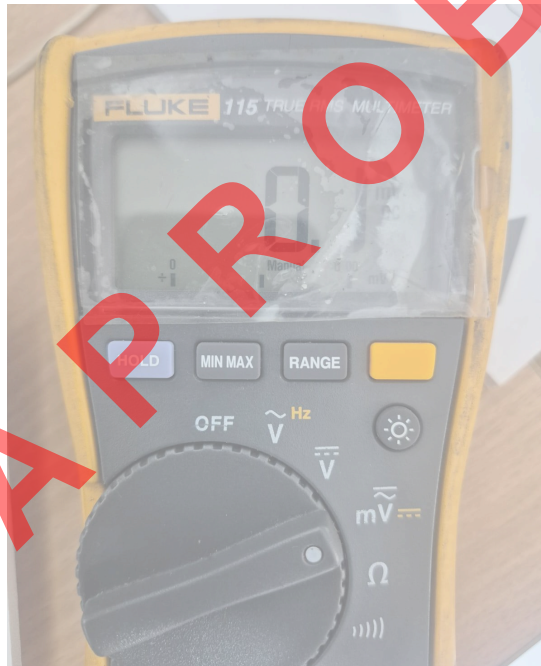
Figura 4. Valor medido en la señal de salida de la balanza sin ningún peso.