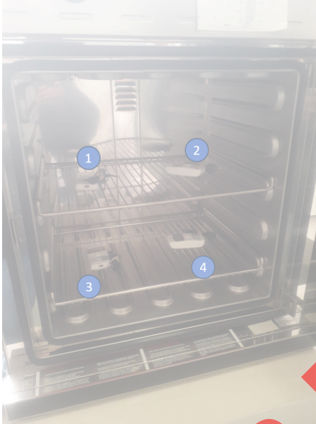
Diagram de Posición de Sensores (Sensor Position Diagram)