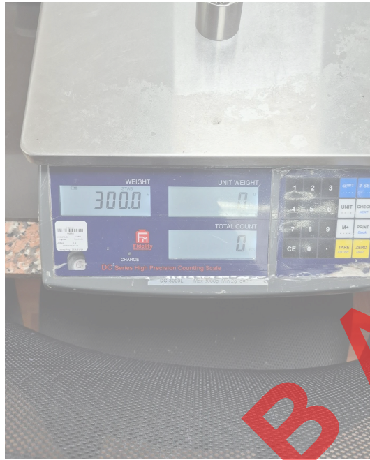
Figura 1. Vista frontal del equipo.