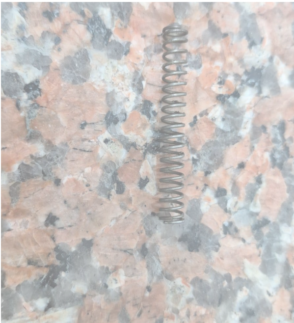
Figura 1: Resorte.