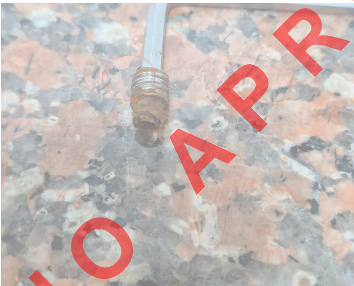
Figura 3: Oxidación