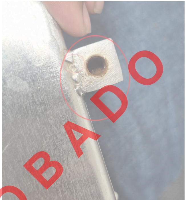
Figura 2: Oxidación dentro donde se ubica el resorte.