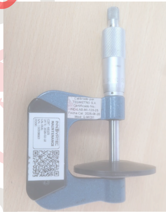
Figura 3. Limpieza del equipo.