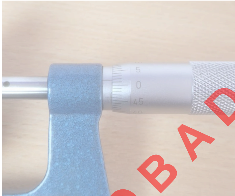
Figura 1. Punto cero encontrado.