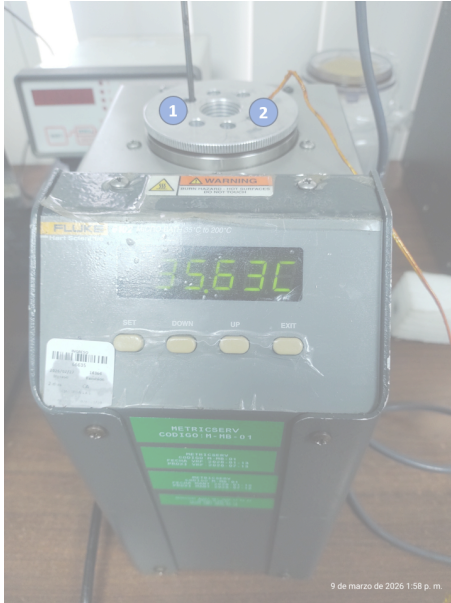
Diagram de Posición de Sensores (Sensor Position Diagram)