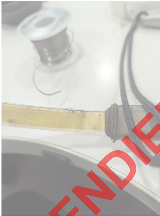
Fig 5. Soldadura realizada, Funcion momentane hasta que se realiza movimiento en la cinta, sugiriendo otro u otros puntos de ruptura.