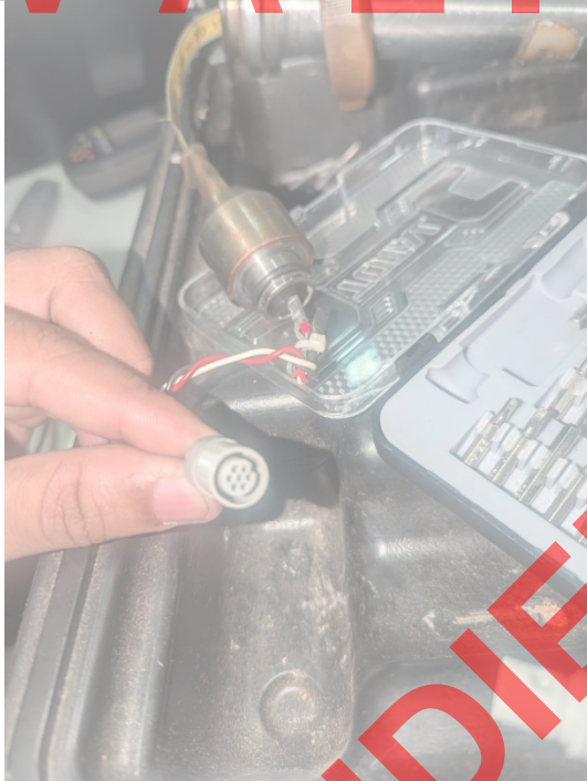
Fig 3. Conector del sensor en buen estado