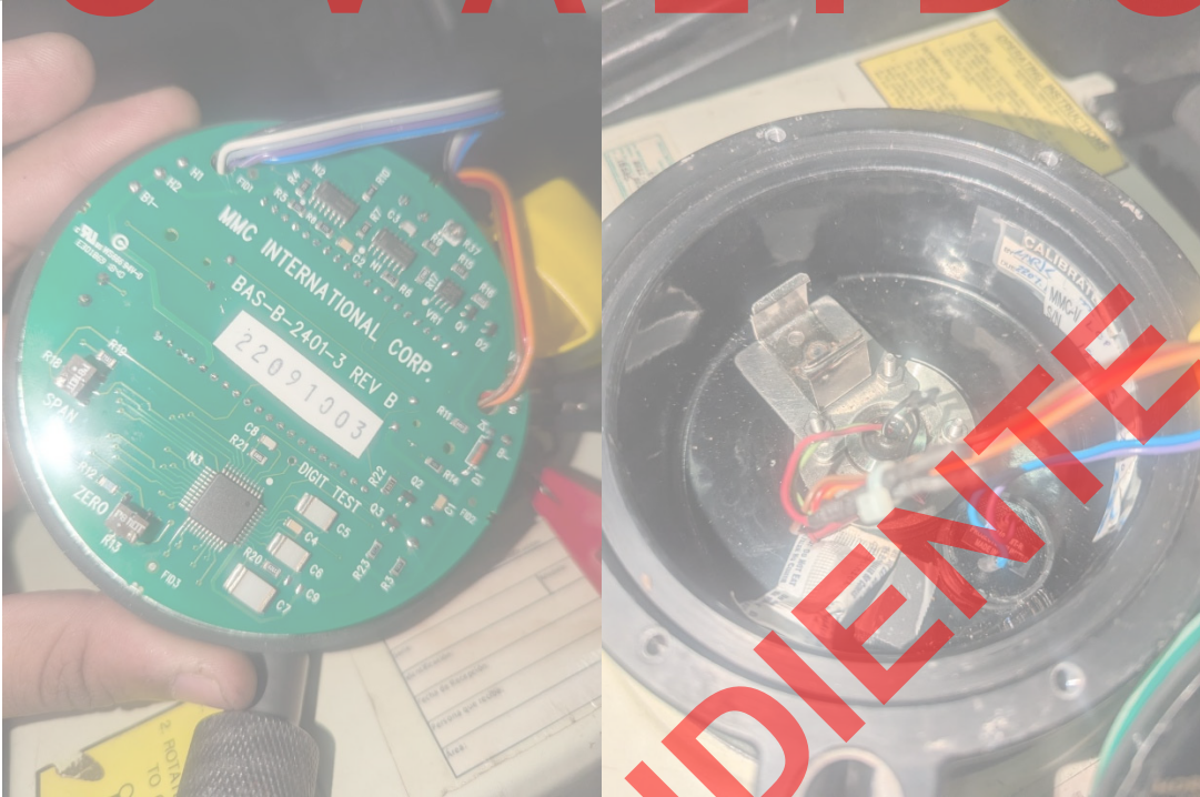
Fig 1 Placa en buen estado