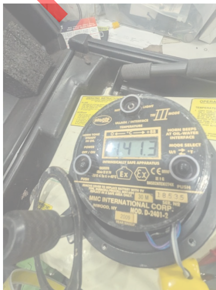
Fig. 6 Falla persistente en el equipo.