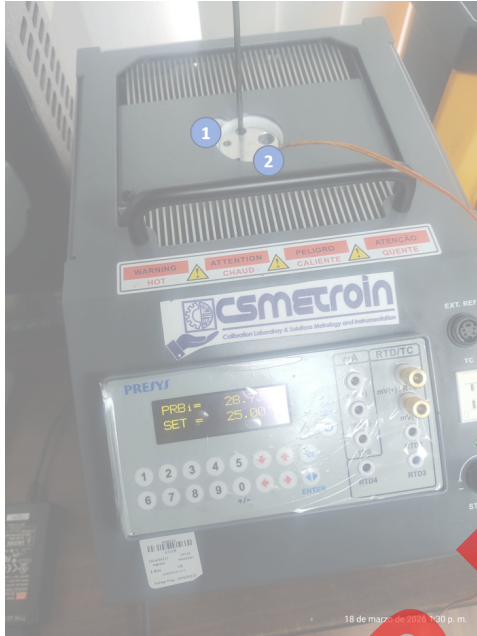
Diagram de Posición de Sensores (Sensor Position Diagram)