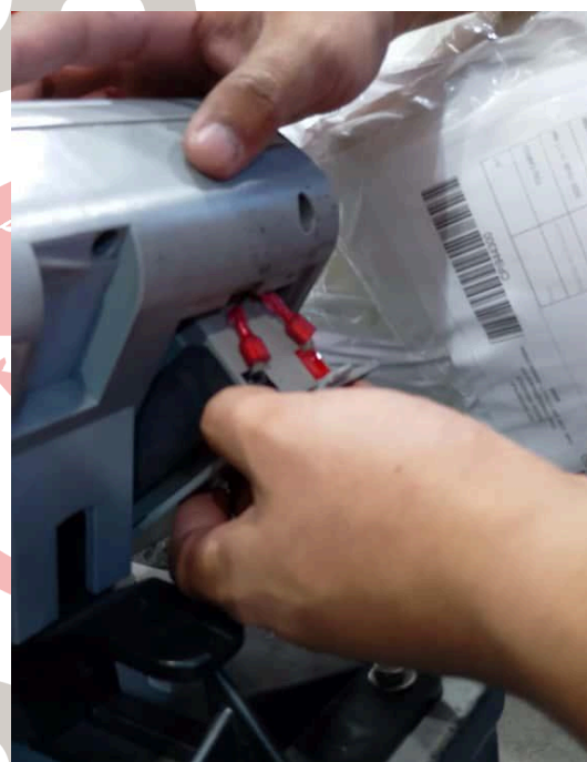
Figura 2. Cambio de batería y encendido del equipo.