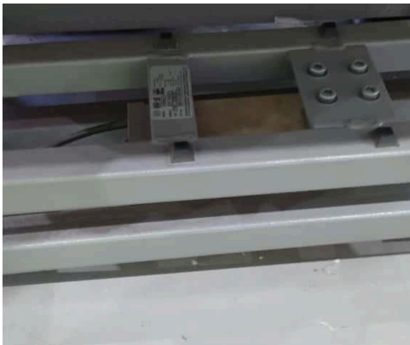
Figura 1. Base de la balanza.