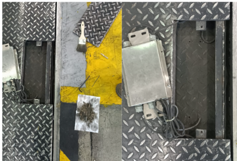
Fig. 1 Mantenimiento del Equipo