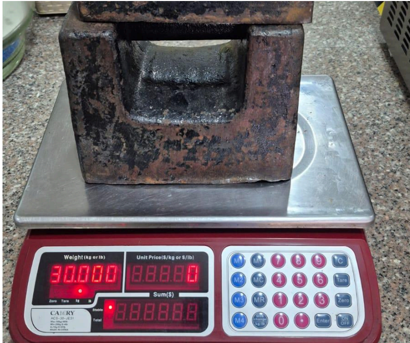
Figura 1. Funcionamiento y ajuste del equipo.