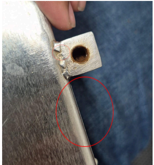
Figura 2: Oxidación dentro donde se ubica el resorte.