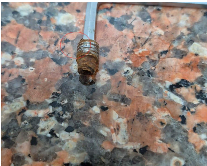
Figura 3: Oxidación