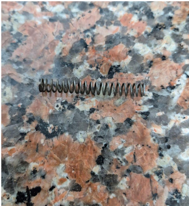
Figura 1: Resorte.