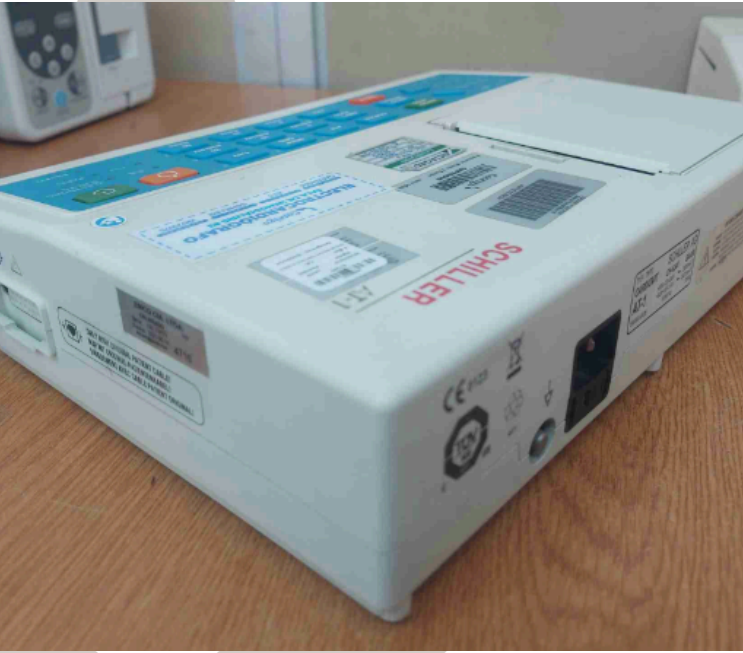
Figura 1. Vista General del Equipo.