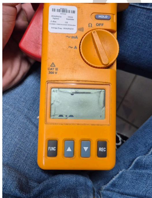
Figura 2. Pantalla dañada.