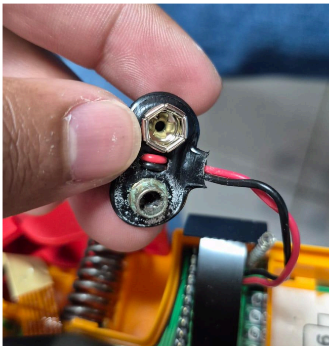
Figura 1. Sección dañada.