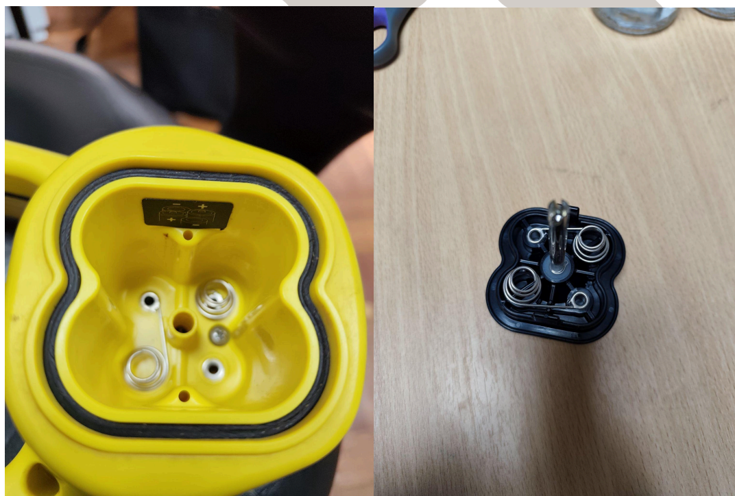
Figura 2. Estado de los bornes del equipo.