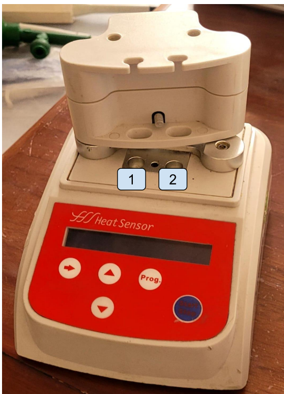
Diagrama de Posición de Sensores (Sensor Position Diagram)