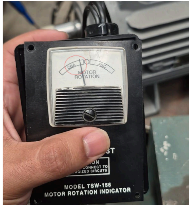
Figura 2: Giro sentido antihorario.