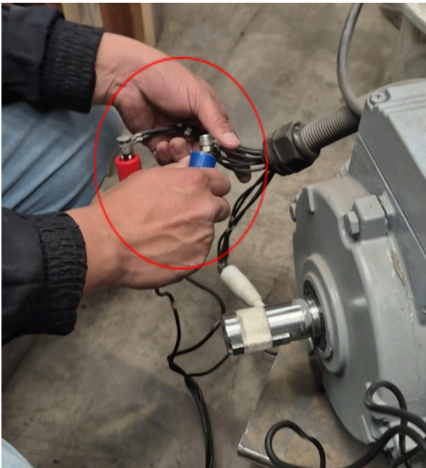
Figura 1: Conexión con el motor trifásico.