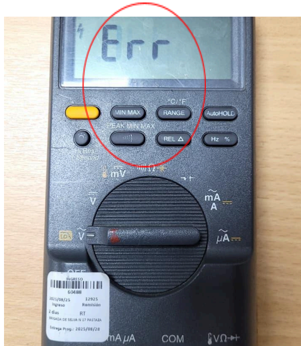
Figura 1. Mensaje del multímetro.