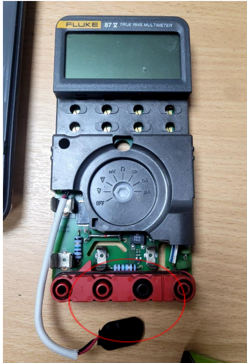
Figura 3. Vista frontal del equipo.