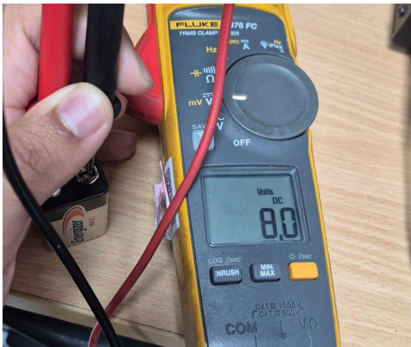
Figura 1. Estado de la batería.