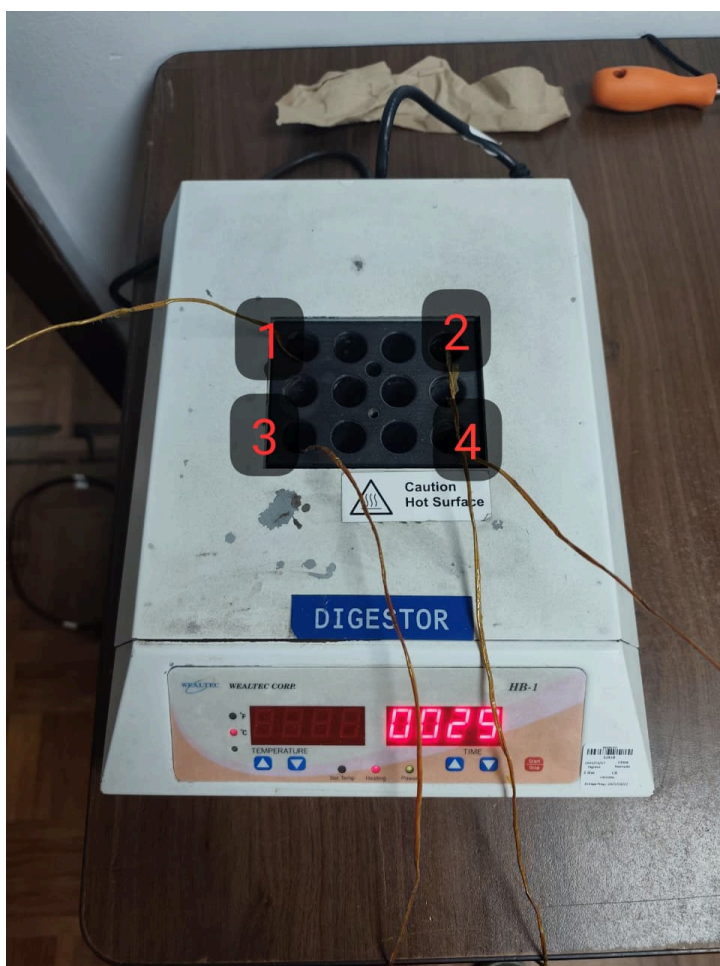
Diagram de Posición de Sensores (Sensor Position Diagram)