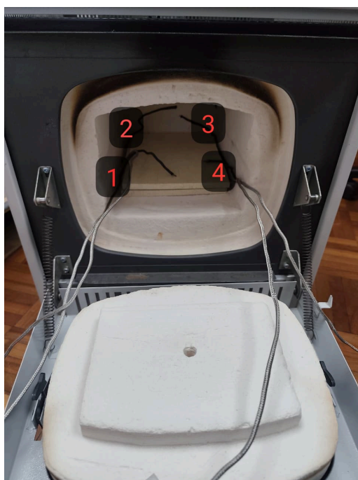
Diagram de Posición de Sensores (Sensor Position Diagram)