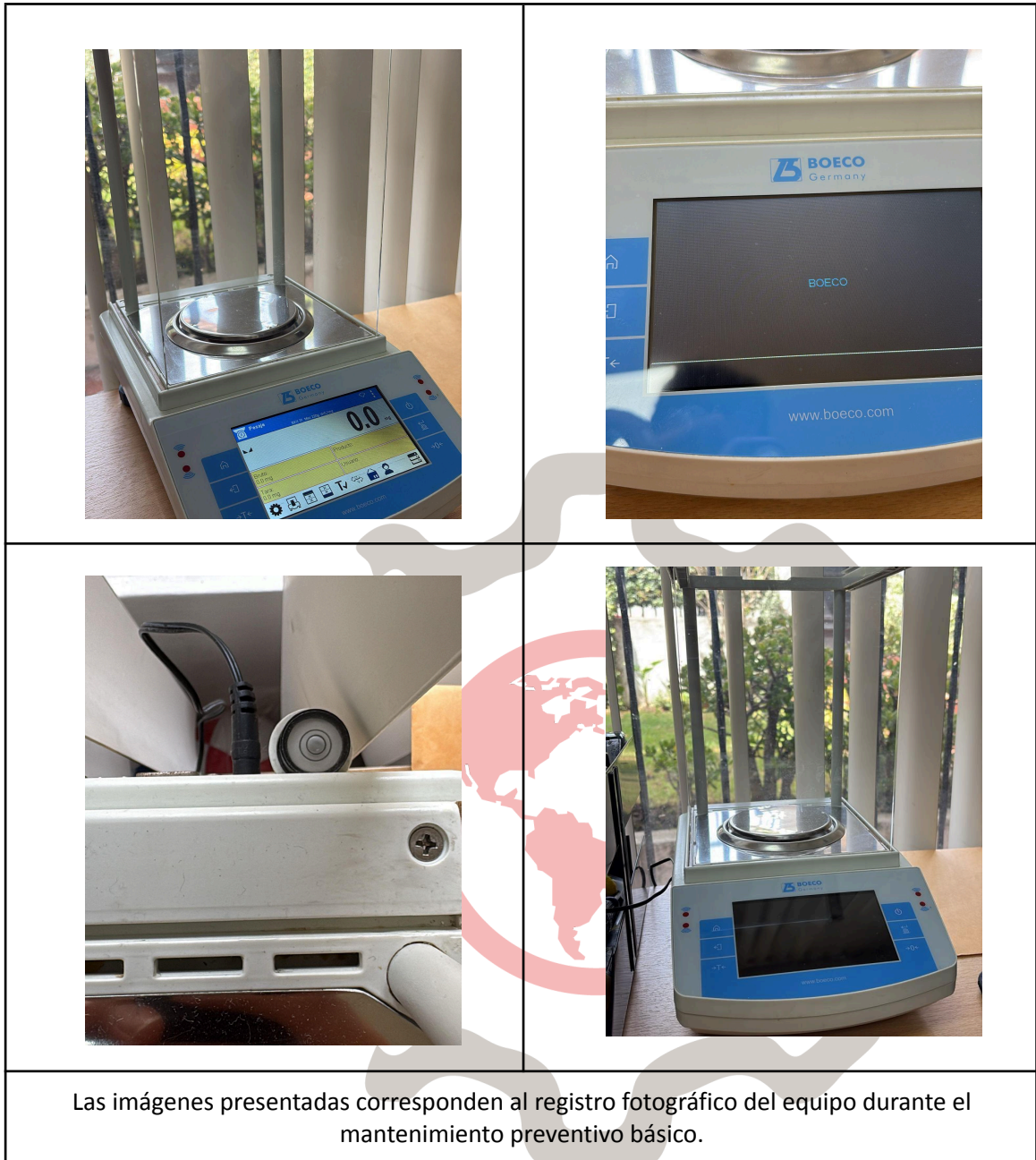
Las imágenes presentadas corresponden al registro fotográfico del equipo durante el mantenimiento preventivo básico.