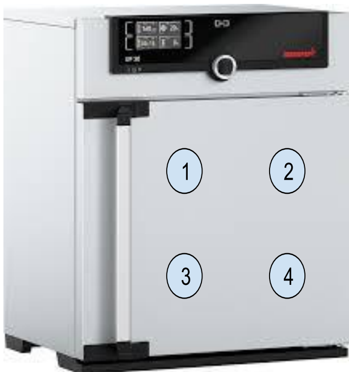
Diagrama de Posición de Sensores (Sensor Position Diagram)