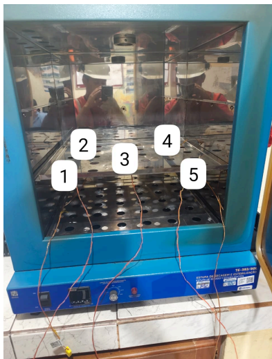
Diagram de Posición de Sensores (Sensor Position Diagram)