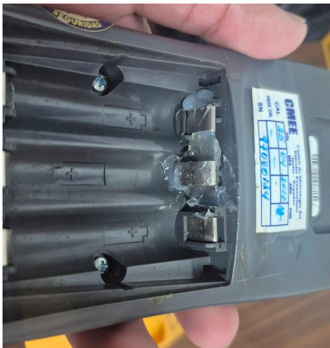
Figura 1. Sección arreglada.