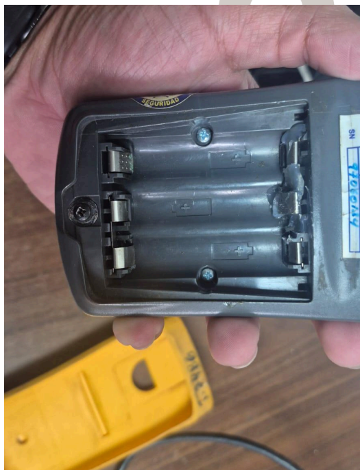
Figura 2. Sección arreglada.