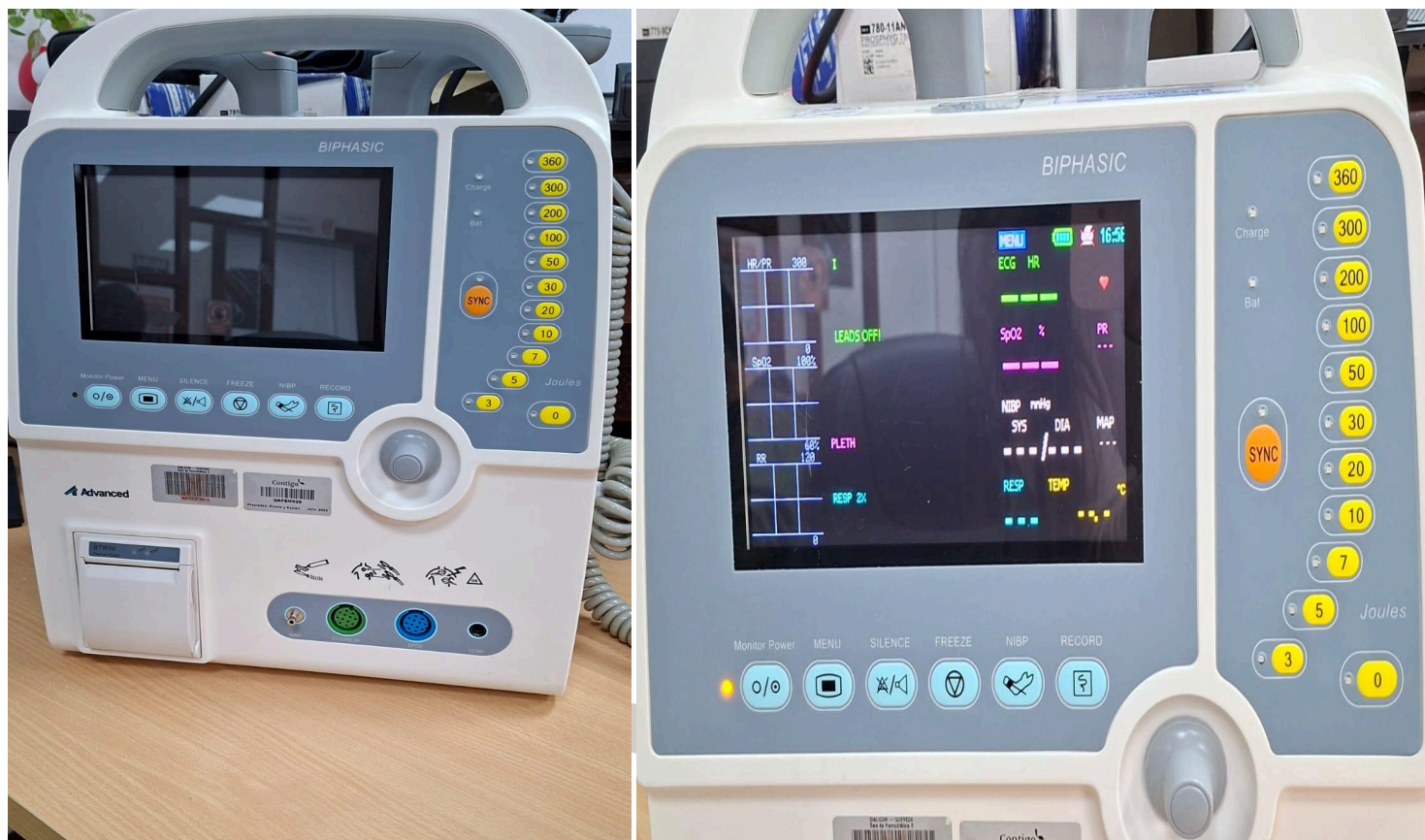
Figura 1. Vista general del equipo.