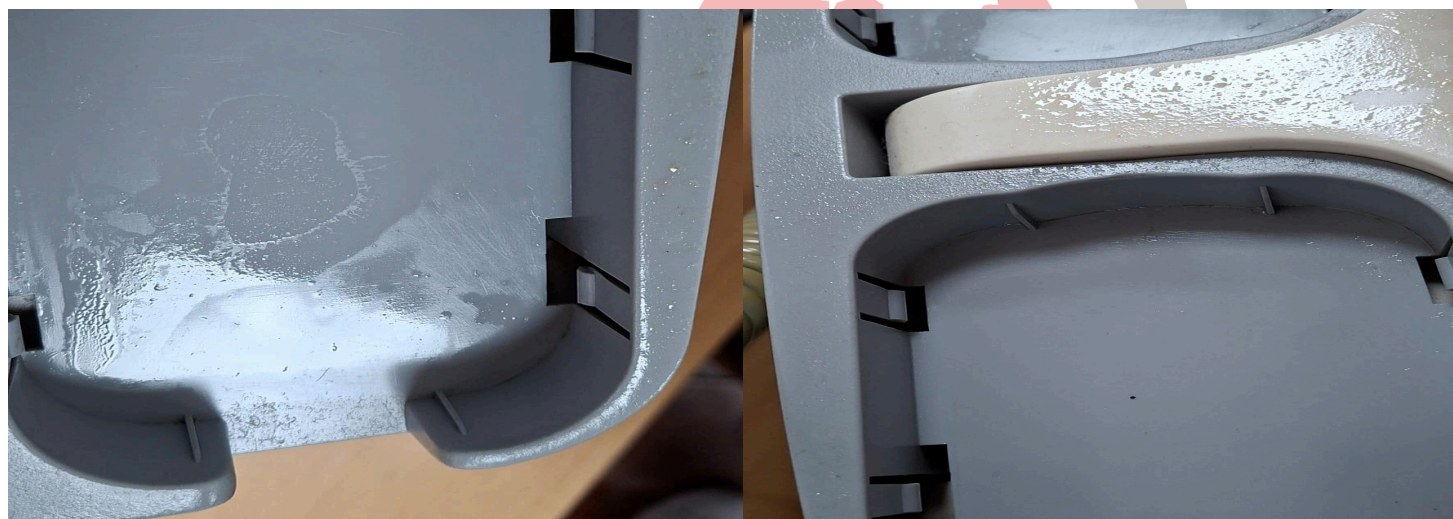
Figura 2. Presencia de aceite en equipo