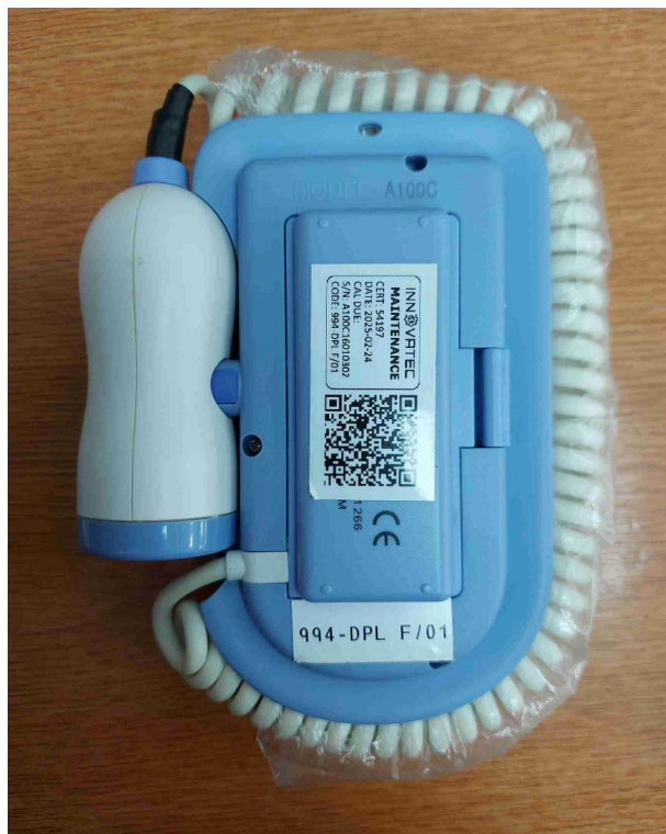
Vista General del Equipo.